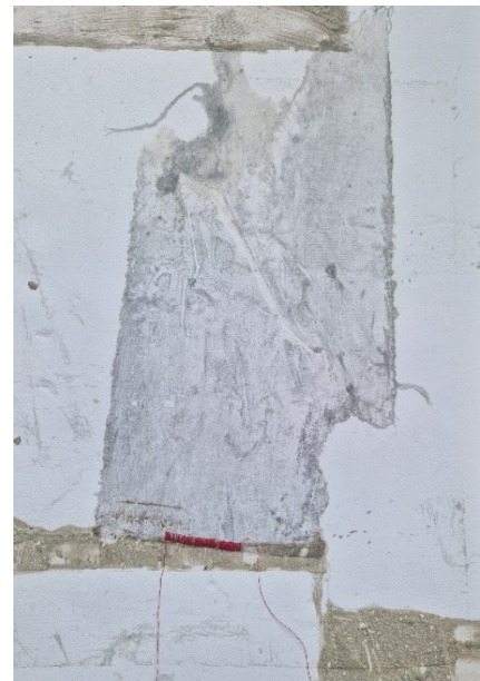
Petra Lupe: aus der Serie Writing like Kafka , 2024